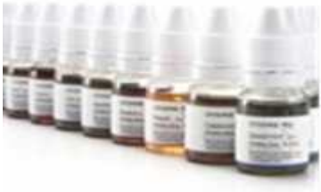
출처 : 전자담배 액상의 유해물질 분석 연구